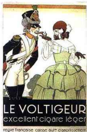
Affiche de René Vincent, vers 1930.