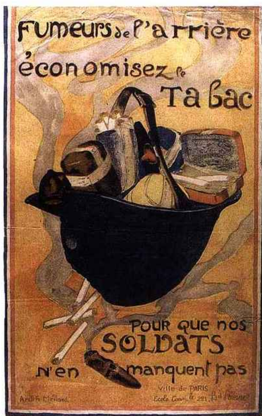
Affiche du Comité national de prévoyance et d'économie, Première Guerre mondiale.

Éric Godeau, Un monde parti en fumée. Les images du tabac en France au XX e siècle , CNRS Éditions, 208 p., 200 illustrations, 19 €.