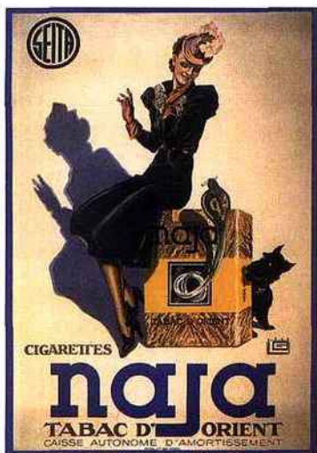
Affiche de Georges Léonnec, 1939.